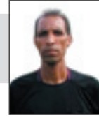
محمد الشيخ خليل حكم دولي

تترقب الجماهير السلوية الغزية لقاء الكلاسيكو الذي سيجتمع الغريمين خدمات المغازي حامل لقب الكأس ومتصدر ترتيب البطولة حتى الآن مع منافسه التقليدي خدمات البريج حامل لقب بطولة الدوري وصاحب المركز الثاني، وذلك مساء غد الخميس على صالة سعد صايل بغزة. هذا اللقاء يحظى عادة بمتابعة جماهيرية كبيرة على مستوى قطاع غزة من الشريحة السلوية التي تمثل نسبة كبيرة من الأسرة الرياضية، نظراً لاحتكار الفريقين البطولات